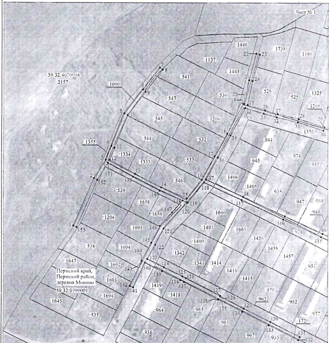
Схема расположения границ публичного сервитута объекта